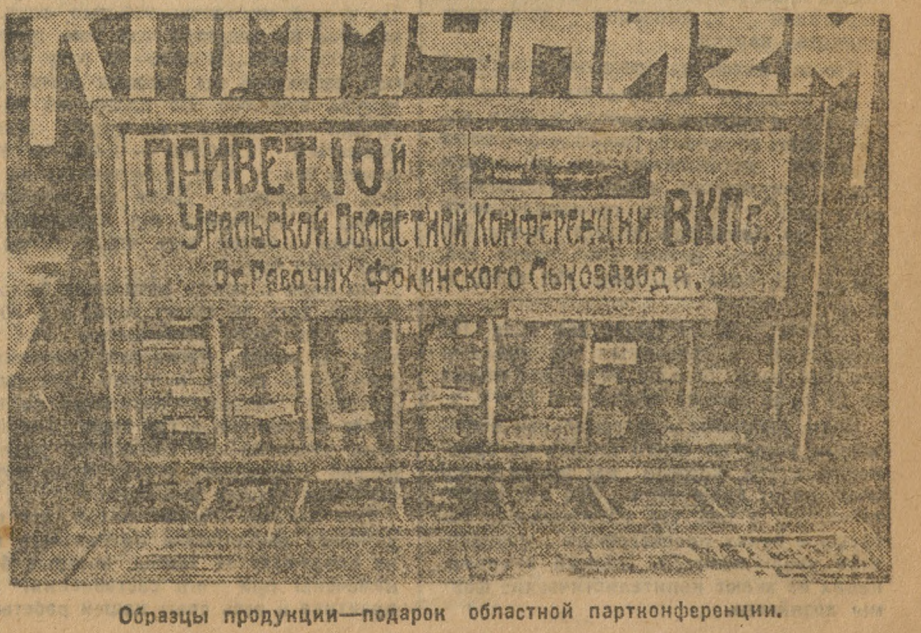
Образцы продукции — подарок областной партконференции.

Во Власовой, Кукаркине, Геродицинске, Баженовские и др. пионеры ходят на поля и читают во время объединенных переывов газет. ТИХОНОВ.