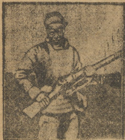
Тип китайского повстанца красноармейца.

ПЕКИН. Нанкинские войска сократили линию фронта в районе Лунхайской, Тяньцзинь-Луцзюской железной дороги и переходят к оборонительной тактике. Они сооружают траншеи в районе Тяньцзиня (станция Лунхайской железной дороги на северо-западе провинции Цзянсу).