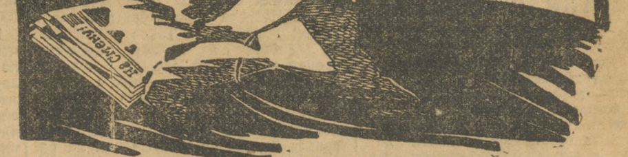
Дашь 50-тыс. тираж «На Смену»!

В апреле охватывала организация около 15.488 членов. Из этого количества