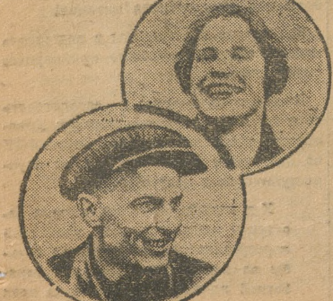
Комсомольцы - делегаты партконференции.

Я хочу закончить заявлением о том, что уральская партиорганизация Урала была и остается крепким оплотом ЦК. Уральские большевики дрались и будут твердо драться за генеральную линию партии.