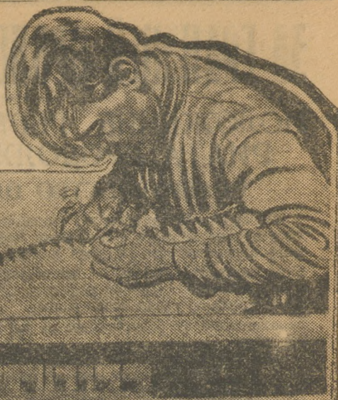
Расширяется свердловская электростанция.