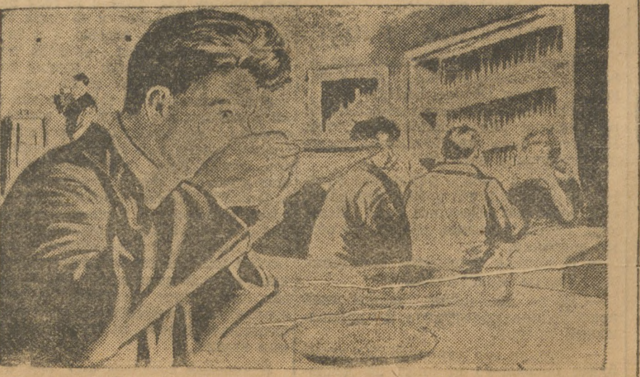
В столовой Высокогорских рудников нет ложек. Рабочие едят прямо из тарелок.

АРТЕМОВСК. На крупнейшей предприятиях организуются новые ударные бригады имени 11 всеукраинского и 16 всесоюзного съездов партии.