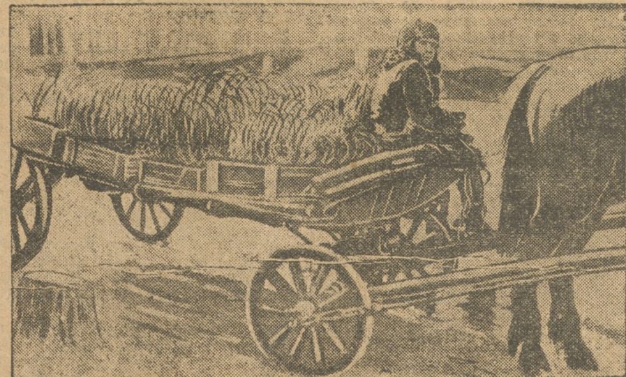
В город со свежим шарташским лугом.

Свердловским русским педагогическим техникумом открыт прием заявлений на 1 семестр по отчислениям: 1) дошкольное, 2) школьное, 3) политпросвет, 4) внешкольное, 5) по труду.