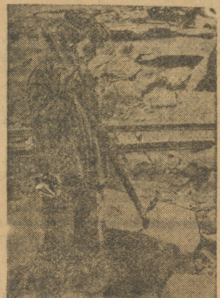
«Механизация» на Тракторострое.

ЛОНДОН. В Северо-западной пограничной провинции Индии повстанцы, во главе с вождем племени Туррайгай, Хаджи, продолжают занимать укрепленные позиции на горах в 30 милях от Пешавара. Отказ Хаджи подчиниться ультиматуму командования нанес удар престижу Англии во всей провинции. Каждое утро и вечер английские самолеты производят демонстрации над штаб-квартирой Хаджи, а также над укреплениями, где сконцентрированы силы сына Хаджи-Бадшехула. Повстанцы обстреливают самолеты. Краснорубашечники и партизанские отряды из крестьян охраняют сына Хаджи, по почтам доставляют его отрядам продовольствия, перерезывают телеграфные провода и т. д.