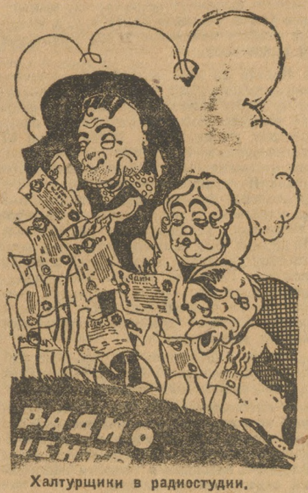
Халтурщики в радиостудии.

Обследование газет, проведенное по поручению комиссии по чистке, привело к выводу, что колхозная радиогазета в настоящее время не приносит никакой пользы. Она не справляется с возложенным на нее поведением кампании и уже это плохо определяет политическое лицо газеты. Рабочая газета в несколько лучшее положение, но и она не справляется с борьбой за промфинплан, показом работы ударных бригад и т. д. Рабочая радиогазета также, как и колхозная, нуждается в немедленной перестройке.