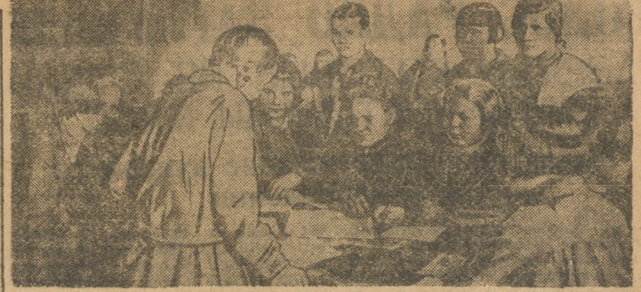
Карабаш. Ударная бригада ударников.

Группами «легкой кавалерии» будет проверено ударничество школ—готовы ли они охватить новые сотни подростков осеннего набора, для чего 27 мая созывается совещание Л. К. о проведении ударного месячника в Тюмени.