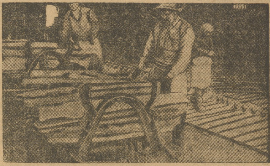
Погрузка чугуна в Билимбае.