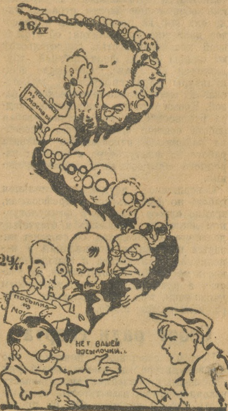
Кривая, на которой вывозит почта.

Ваши московские друзья, возмущенные и потрясенные потерей посылки