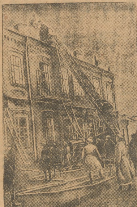
Позавчера сгорела фабрика «Пух и перо». Убытки выясняются.

После долгих задержек свердловская фабрика-кухня, наконец, готова. Открытие ее состоится 1 мая, после демонстрации, в 2 часа дня. Открытие фабрики-кухни ознаменуется торжественным заседанием Горсовета с участием общественных организаций. 2 мая фабрика-кухня начнет нормальную работу. Первое время обеды будут отпускаться только столовой при фабрике-кухне. Затем, по мере готовности оборудования, фабрика будет снабжать обедами и другие столовые.