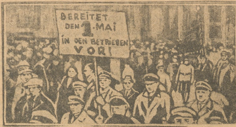
На снимке—массовая демонстрация рабочих в Берлине в знак протеста против нового правительства. Среди многочисленных плакатов—плакаты с призывом к подготовке выступления 1-го мая.