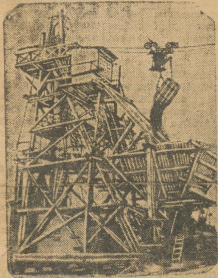
Кабельяраны на Асбесте.

Уралпрофсовет решил 27 апреля провести областной слет ударников. Этот слет должен подытожить опыт социалистического соревнования на Урале, обобщить опыт работы ударных бригад и производственных коллективов. На совещании ударников будет заслушан доклад о политическом положении и доклад революционно-производственного совета о социалистическом соревновании. Секции совещания проработают вопросы о работе производственных коллективов, о системе учета результатов соревнования, об участии инженерно-технических сил в соревновании. На совещании должны быть выделены лучшие ударники предприятий. Все комсомольские организации должны развернуть массовую работу, обобщить опыт соревнования, принять участие в подготовке и проведении слета ударников.