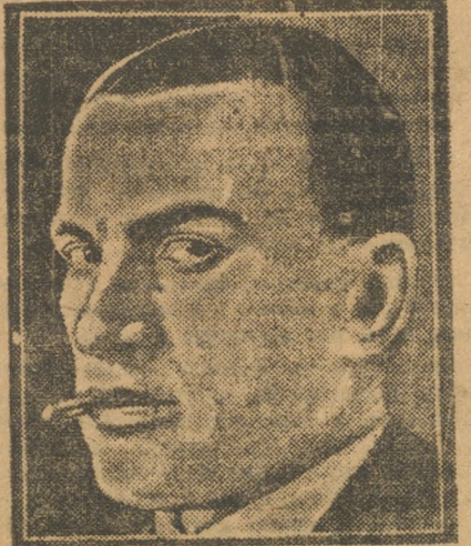
В. В. Маяковский.

пошел сныгаться вороном. Опустили головы — еще нагни! Вадржали вдруг и стали черными лостр расплывшихся огни. Захлебнуло колокольчика ненужный щек. Превозмог себя и встал Калинин. Слезы не сжуешь с усов и щек. Выдали. Влетит у бороды на клане. Мысли смешались, Голову мнут. Кровь в виски Клокочет в вене: — Вчера в шесть часов пятьдесят минут скончался товарищ Ленин! — Этот год вадал, чего не взвидит это. День векам войдет в тоскливое преданье. Унас из железа выжал стон. По большевикам прошло рыданье, тяжесть страшная! Самих себя же выволакивали волоком. Рауанать — когда и как? Чего таят! В ушки и в переулки катафалком лзыл Большой театр. Радость ползет улеткой. У горя бешеный бег. На солнца на льдин слитка — все сквозь газетное ситко черный засеял снег.