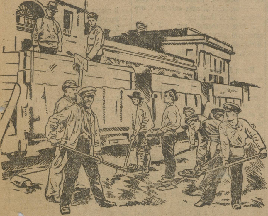
КОМСОМОЛЬСКИЙ СУББОТНИК НА ВЕРХ-ИСЕТСКОМ ЗАВОДЕ В 1920 Г.

Начало 1921 года принесло для комсомольской организации Урала новое испытание — фронт борьбы с бандитизмом. Часть Тюменской и Челябинской губерний охватывается кулацким восстанием. Проводится экстренная мобилизация комсомольцев. Витовка беретась в руки. Комсомол организует десятки боевых отрядов, на борьбу с озверевшим кулачеством идут тысячи человек молодежи.