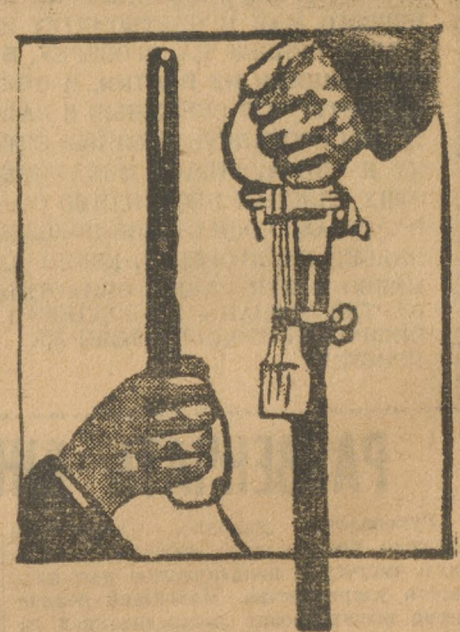
Рисунок из немецкого коммунистического журнала.