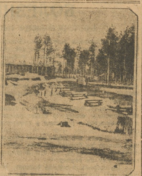
В Сухом Логу перед строительством