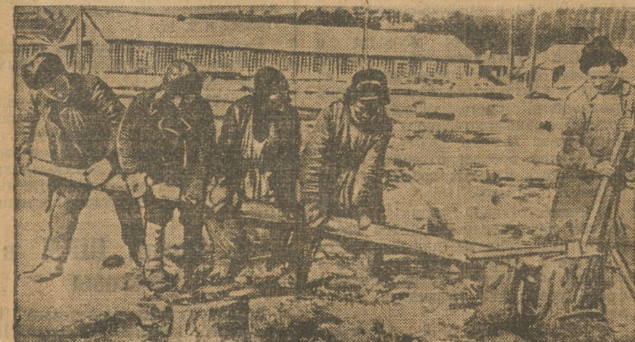
Корочки пней из Уралмашинстроя.