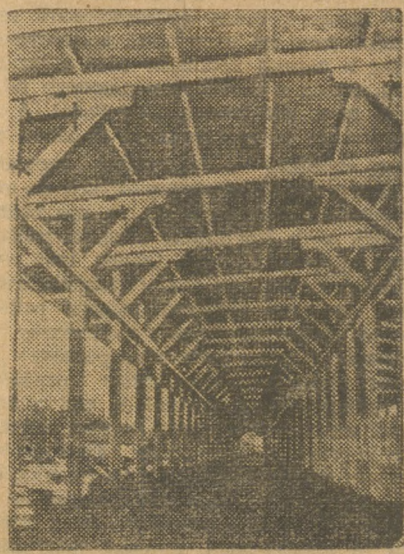
На постройке шамотного завода, (Сухой Лог).

ячейка кузницы по подготовке к юбилею пошла вперед. Она собрала ударников, обдумала с ними новый договор соцсоревнования, создала бригады по проверке старого договора.