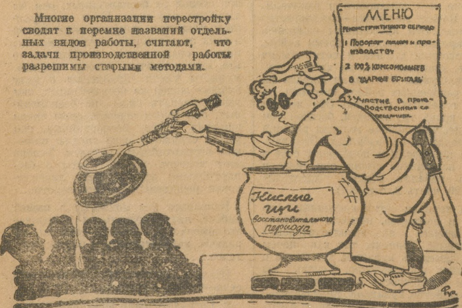
Стрелуки от комсомольской кухни.

Многие организации перестройку сводят к перемене названий отдельных видов работы, считают, что задачи производственной работы разрешимы старыми методами.