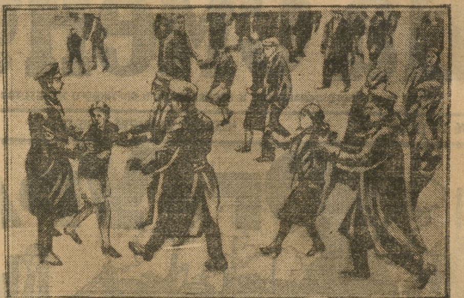
Нью-йоркская полиция арестовывает женщин и детей на коммунистическом митинге.