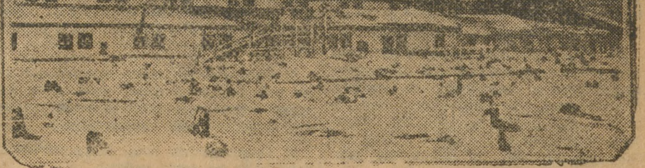
Угольномашинстрой. Постройка ремонтно-строительного цеха.