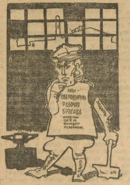
Модный костюм а-ля-ударник.