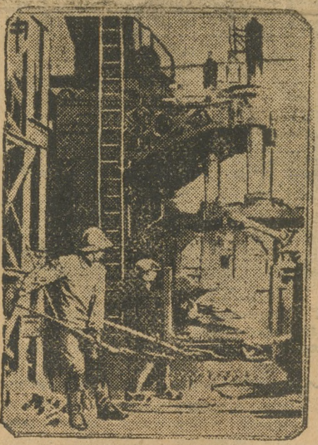
Электрощит на В.Исетском заводе.