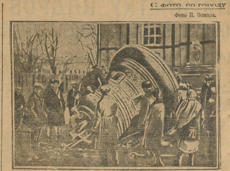
16000 килограмм меди, в которой остро нуждается наша промышленность, даст коллоид, снятый с Златоустовской церкви.

Назлось бы, что в таких условиях начавшемуся смотру общественного питания в Челябинске должны были