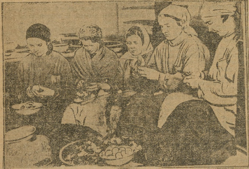
Из сотысячных прибылей ЦРК не мож ет приобрести механическое оборудование для столовых. На снимке: чистка картофеля в столовой Уралмашиностроя