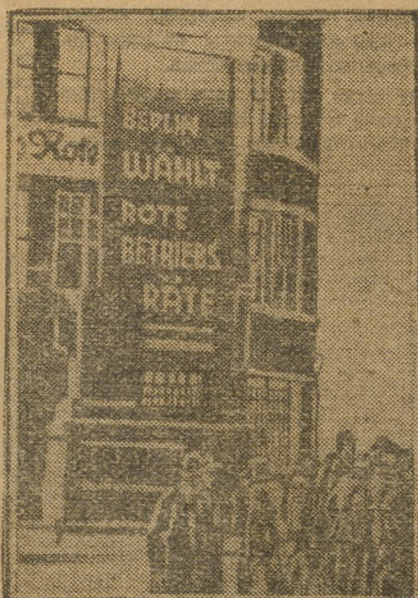
На снимке — агитколлонна, выставленная перед помещением ЦК германской компартии в Берлине. На колонне надпись: «Красный Берлин выбирает красные флажки».

БЕРЛИН. На анилиновых заводах концерна Биттерфельде в Саксонии оппозиционный список на выборах в завод получил 969 ГОЛОСОВ объединенный список социал-фашистов и брендлеровцев только 857 голосов. В шахте Неймюль, в Рурской области, революционный список получил 2205 ГОЛОСОВ, социал-фашисты 437. На машиностроительном заводе в Зеллингене-Вюртемберге оппозиционный список получил 1175 голосов, 10 мест в законе, социал-фашисты 321 голос, 3 места.