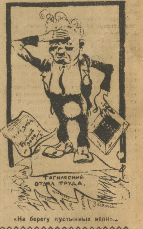
«На берегу пустынных волн».