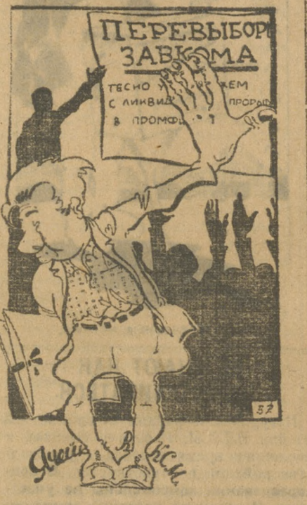
Наше дело сторона...