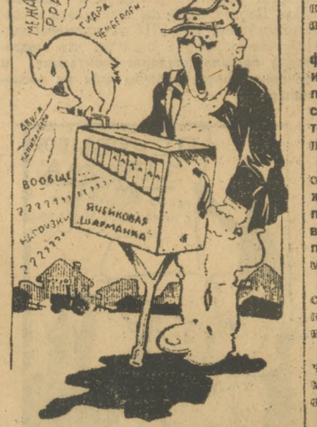
На злободневные мотивы.