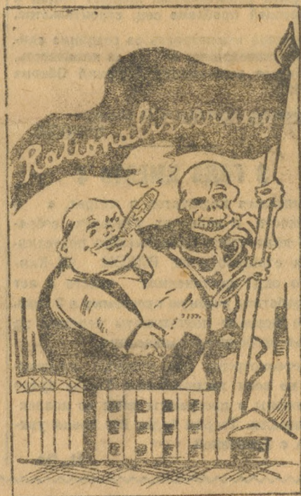
На черном знамени капитализма позвиг «Рационализация».