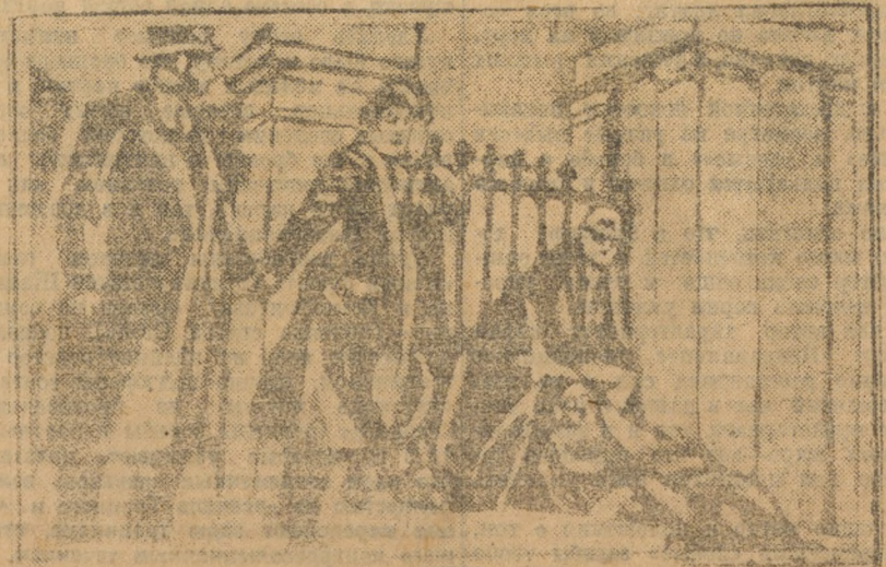
Избиения и арест безработных в Бостоне (САСШ).