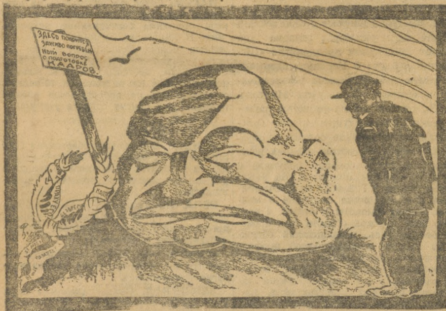
ЛЖИТ НА НЕМ КАМЕНЬ ТЯЖЕЛЫЙ...