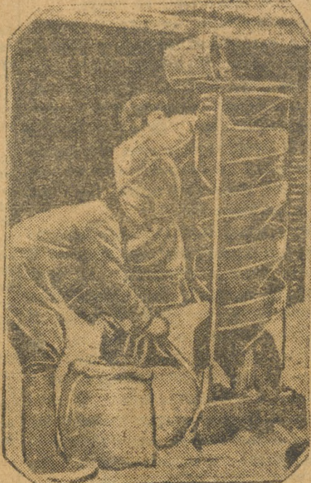
Колхозники сортируют зерно.

(Из постановления ноябрьского пленума ЦК ВКП(б).)