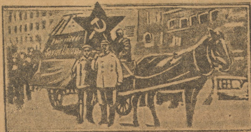
Демонстрация красных фронтовиков в Магдебурге (Германия). На переднем плане — плакат с надписью: «Рабочие, защищайте Советский Союз».