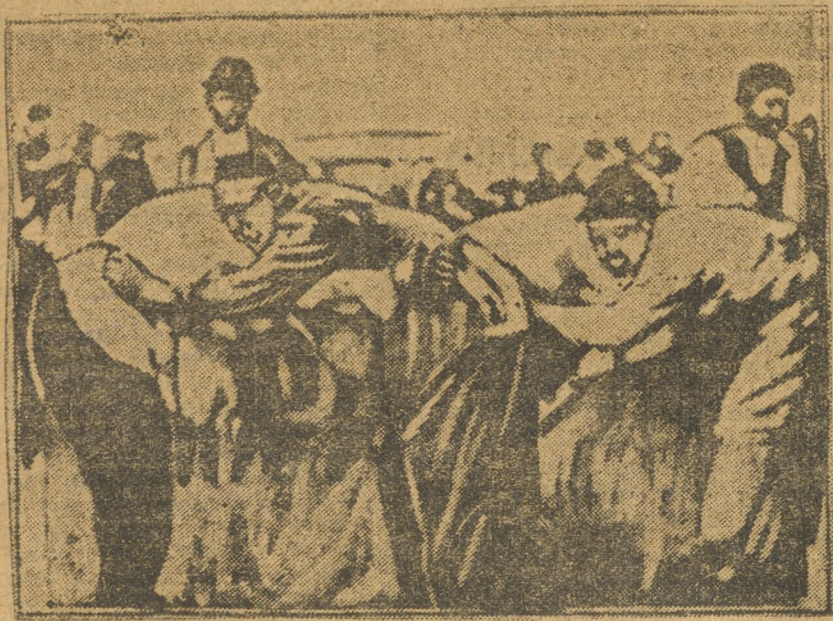
Борьба—время препровождения татар.