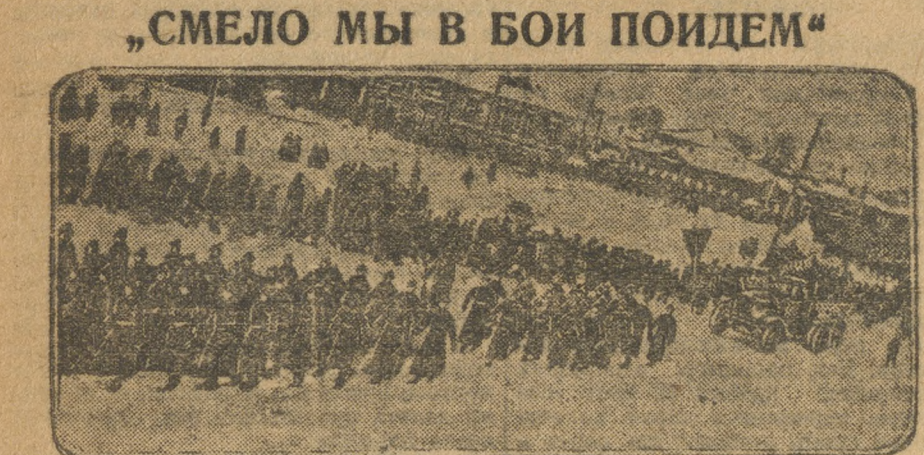
„СМЕЛО МЫ В БОИ ПОИДЕМ“

ЗАЛЕЖИ НА ПОЧТЕ пша Богомысленский. Рева, вредитель-он проле даже в члены рабочего комитета связи. Касир почты Таршилов—дерконый староста. Если покопаться в списках почтальонов—можно, вероятно, найти и еще ряд таких же типов. Таким образом, можно и здесь предложить прямое вредительство. В Н.-Сергашском почтовом отделении точно также сидят худые люди. ГОТОВЬТЕ КАДРЫ. На почтовых организациях в настоящее время лежит большая задача—отать проводниками культурной революции, распространителями партийно-советской печати. Проведенный в свое время смотр работы связи вскрыл много недочетов. Кое-что устранено, но в общем положении осталось без перемен. Это «без перемен» объясняется тем, что почтовые организации не уделяют внимания подготовке новых кадров работников, могущих заменить чужанов, приютившихся на почте, прикрывшихся спецдедовой почтацией. Почтовым организациям надо работать именно на этом участке. Иог. Г.