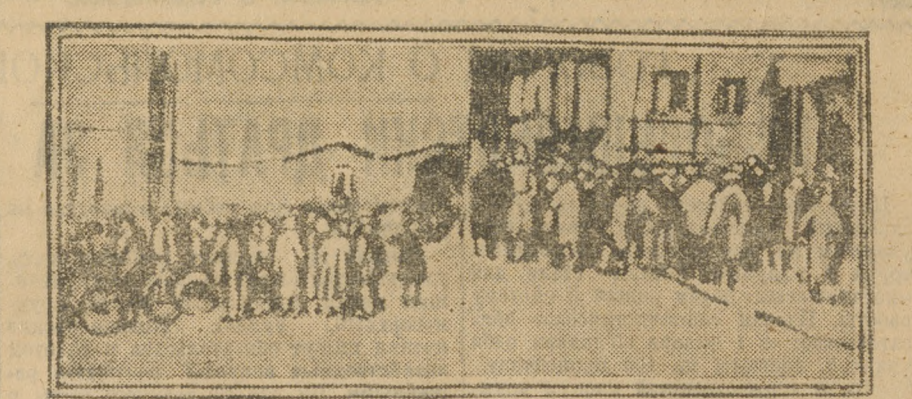
На снимке: слева — группа бастующих трамвайных служащих в Бердо, справа — бастующие рабочие заводов телефо...