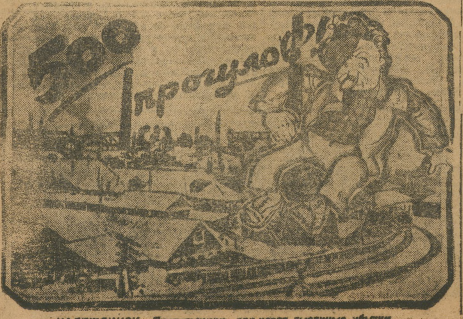
НАДЕЖДИНСК. Прогульщики подносят тысячные убытки.

По мелкобуржуазной расхлябанности, по «самотеку», по неумению организовать массы для борьбы за выполнение промфинплана надо ударить. Фронт металла в Надеждинске прорван. Надо мобилизовать все силы, чтобы вырвать фронт, смыть пятно позора, взять боевые темпы в атаку за металл.