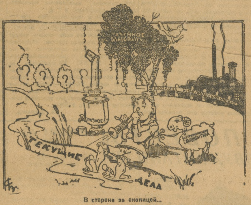
В стороне за околицей...