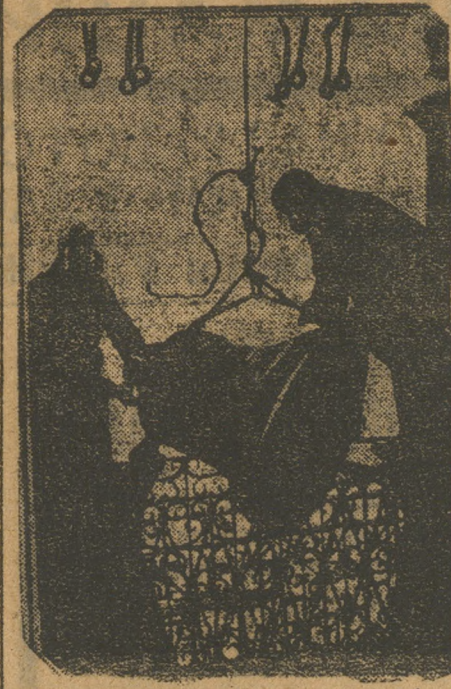
«Разоружения» Кафедрального собора.