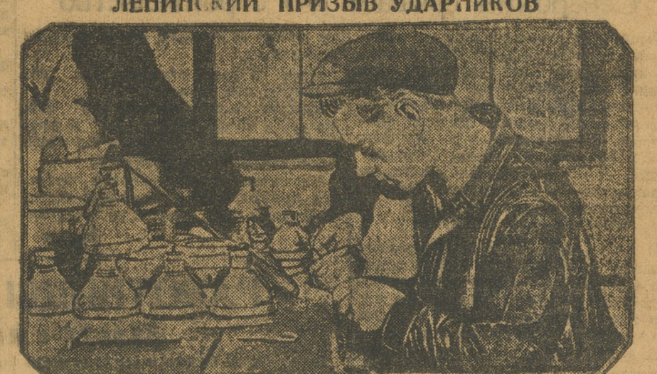
Ударник на Уралсепаторе.