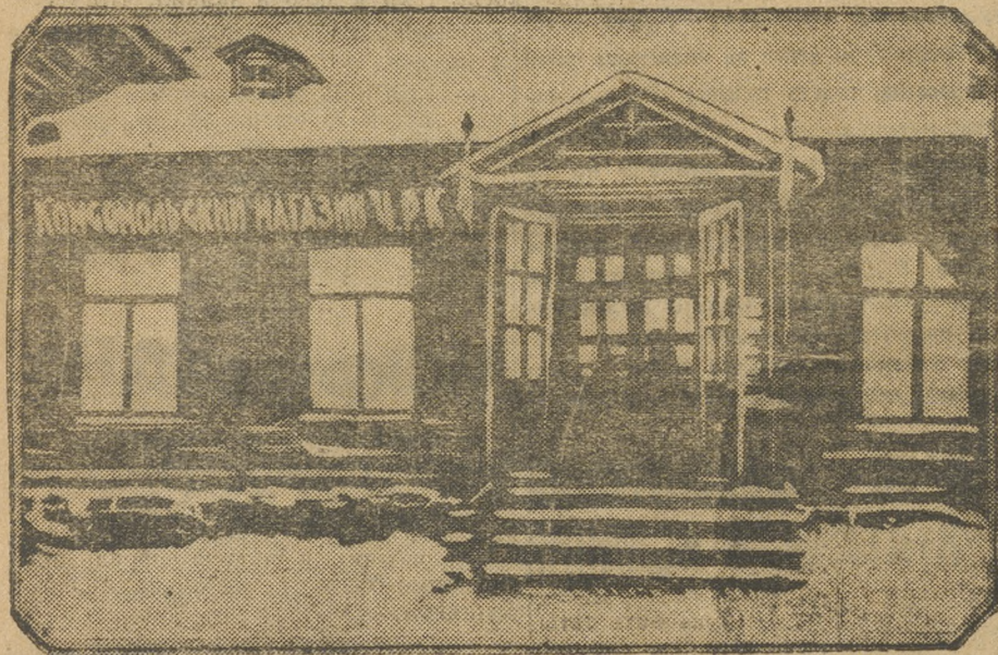
Комсомольский магазин ЦРК Чусовского завода.

Мы вступили в новую историческую эпоху — эпоху социалистического строительства. Правильность партийной политики наступления на кулака и бурного развития колхозного движения, неуслышное осуществление этой политики, вопреки всем прочтением правых оппортунистов и появившихся героев «левой» фразы, привели к закреплению и упрочению позиций обществленного сектора деревни, обеспечили возможность совершить поворот и перейти от политики ограничения эксплуататорских тенденций кулачества к политике ликвидации кулачества как класса.