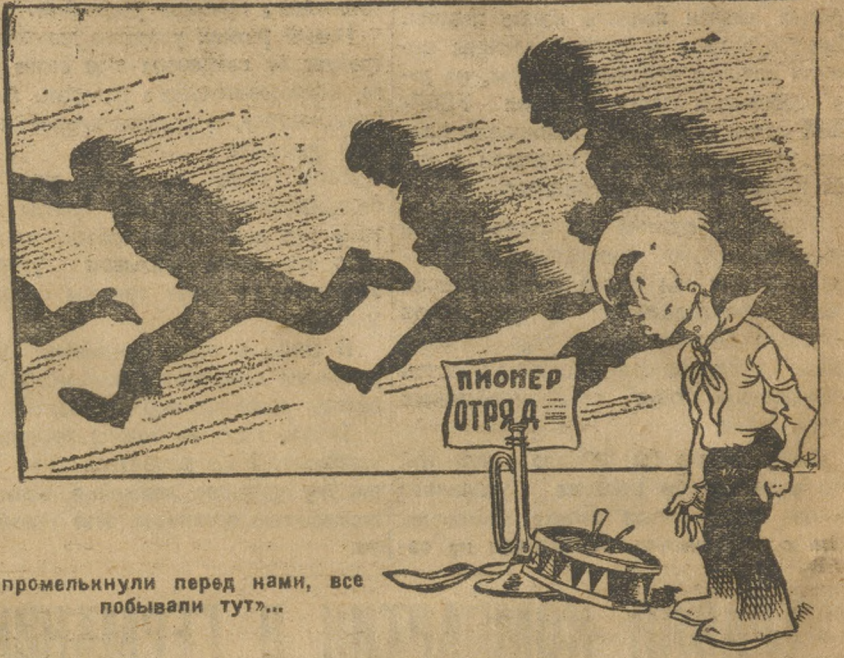
«Все промелькнуло перед нами, все бывало тут...»