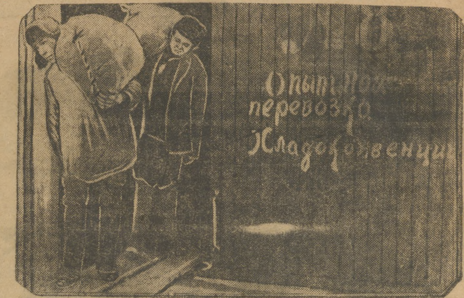
В Свердловск прибыло 10 вагонов картофеля в сопровождении работников хладоконвоя. Способ перевозки совершенно новый и впервые применен в СССР. В вагонах применены особые щиты на полу и вдоль стен, благодаря чему теплый воздух свободно циркулирует по всему вагону и картофель не замерзает. На снимке—выгрузка из вагона.