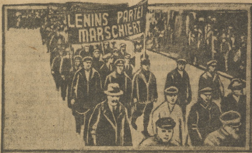
Демонстрация, организованная германской компартией, проходит по улице Берлина. Впереди—демонстранты с лозунгом: «Партия Ленина идет».