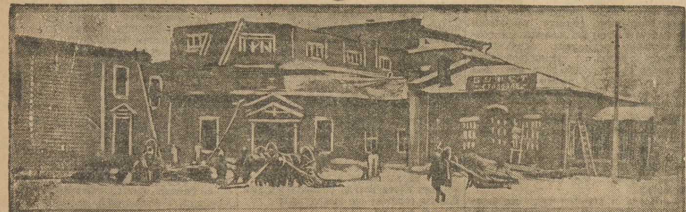
Закрывается Стройконтролем кино-театр «Пролетарский» идет на слом.

«На Смену» издавала писала о политических ошибках, допущенных в работе библиотеки имени Ветлиного. Сейчас принимаются меры, чтобы выправить работу библиотеки. Секция наробраза предложила библиотеке отказаться от обслуживания нетрудовых элементов. Это решение вызвало тем, что библиотека чрезвычайно затруднена читателями и имеет очень ограниченный книжный фонд. Библиотека, таким образом, переходит на обслуживание книгами исключительно трудящихся.