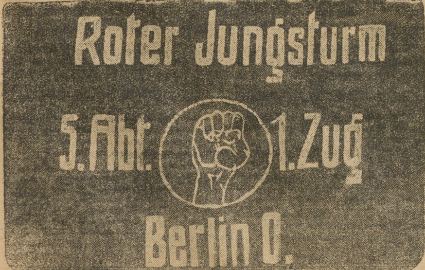
ЗНАМЯ КРАСНЫ ХФРОНТОВИКОВ БЕРЛИНА, ПРИСЛАННОЕ ИМИ В ПОДАРОК УРАЛЬСКОМУ РАБСЕЛОВОСКОМУ С'ЕЗДУ, КОТОРЫЙ ПЕРЕДАЛ ЕГО ГАЗЕТЕ «НА СМЕНУ».

— Либкнехт! — АНРИ БАРБЮС. (Отрывок из романа «Огонь».)