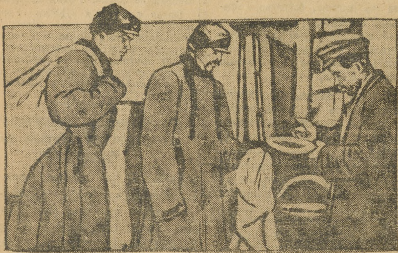
Сдают зерно в семенной фонд.

Начинается ударный двухнедельник. Молодежь должна и здесь быть в первых рядах. Гр. П—н.