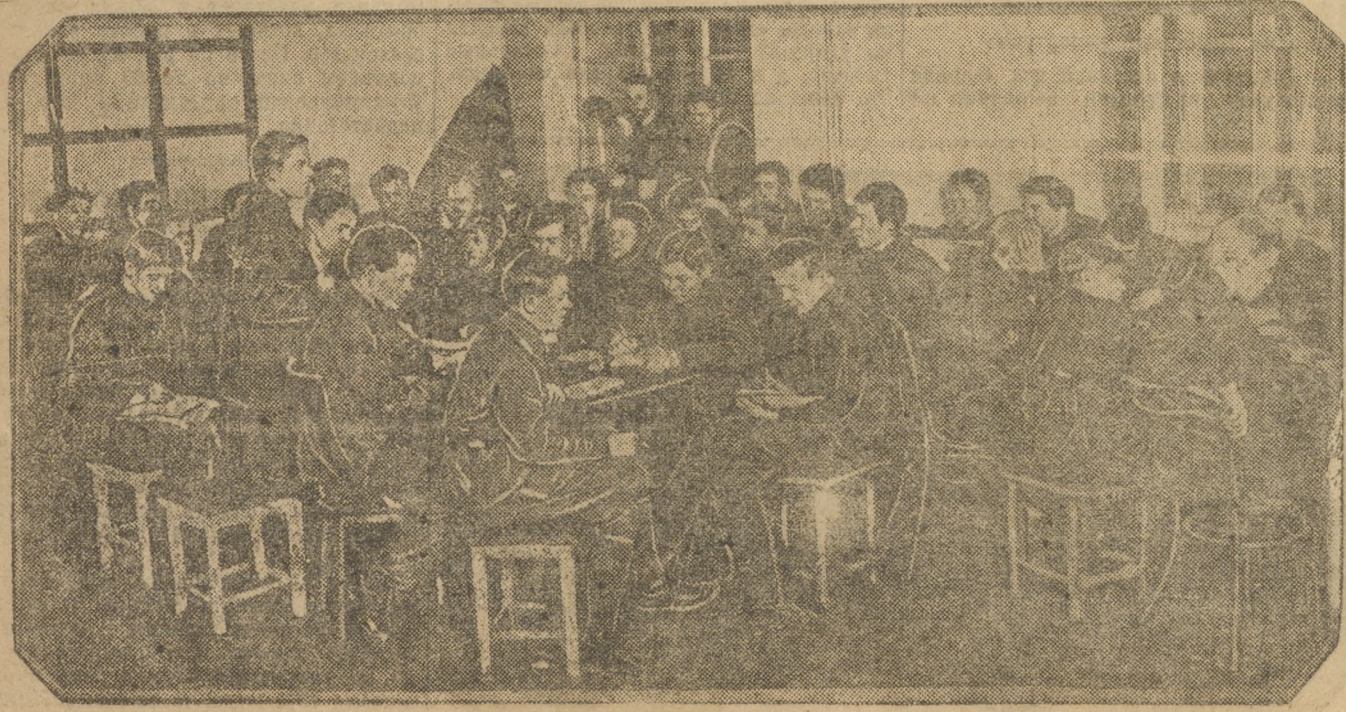
Юнкорская секция за работой.