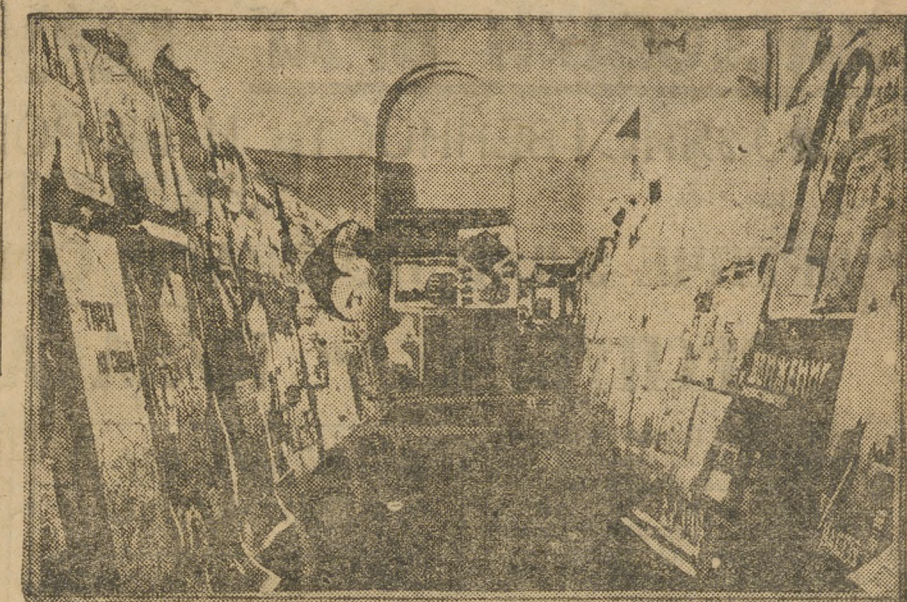
Выставка «На Смену» на рабселькоровском совещании.

Социалистическое соревнование подняло у рабочих чувство ответственности. Предъявляя повышенные требования к себе они повышают, требования и к качеству руководства, партийного, советского, хозяйственного профессионально-