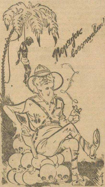
Сладкий отдых после тяжелого труда.

В Нигерии (Английская колония в Африке) войсками расстреляна огромная толпа женщин-туземок. Агентство «Рейтер» сообщает, что в Нигерии восстановлен полный порядок.