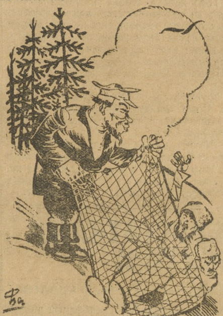
Сети кулака Гурьева.

База превратилась в проходной двор. Партия завербованных рабочих приходили в контору базы, получали хлебобулочные и денежные авансы и... двигались дальше. Хлебобулочные выписывались на 150 человек, а в то же время фактически работало на базе 25 человек.