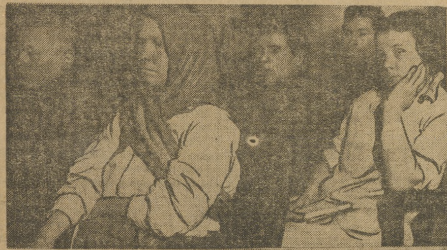
Делегаты на совещании.