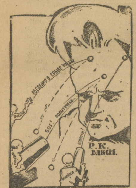
Как в стену горох...

половину не посещают. В ячейке № 7, при ЗИУ все комсомольцы, и даже большинство беспартийных было охвачено по политучебы.