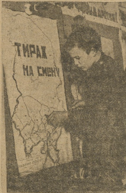
Юнкор у электроплатката. Тираж «На Смену».