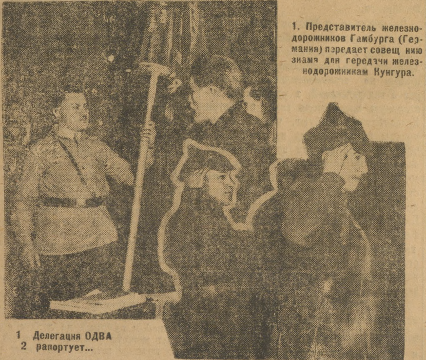
1. Представитель железнодорожников Гамбурга (Германия) президет совещанию знамя для германских железнодорожников Кунгура.