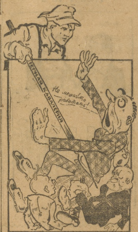
ПИСЬМА С ЗАВОДОВ