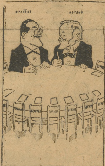
— Конференция заседает... («Изв.»)