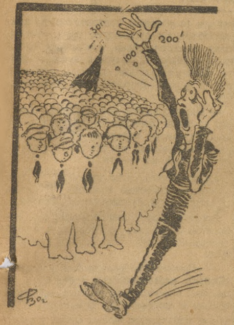
Один в поле не воин.