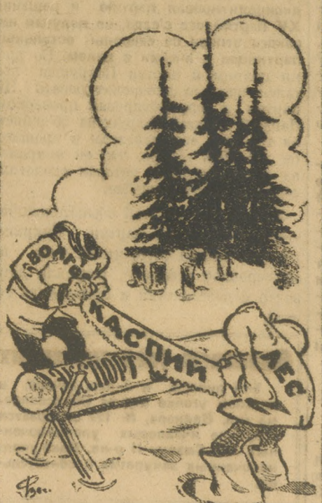
Заготовка идет полным ходом...

Сверху—из Москвы и Перми, из руководства ВКЛ в отделение верохо-