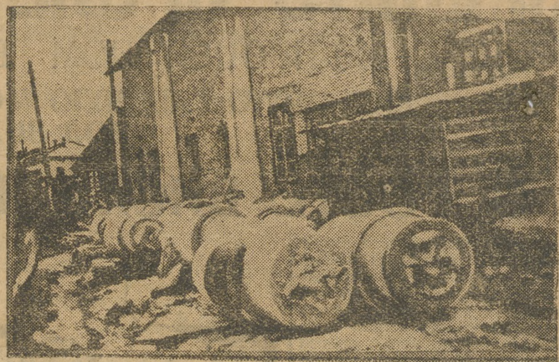
Склад беспризорных валков на Алапаевском заводе.

Сегодня тов. Иванов выходит из Свердловска по направлению на Пермь.