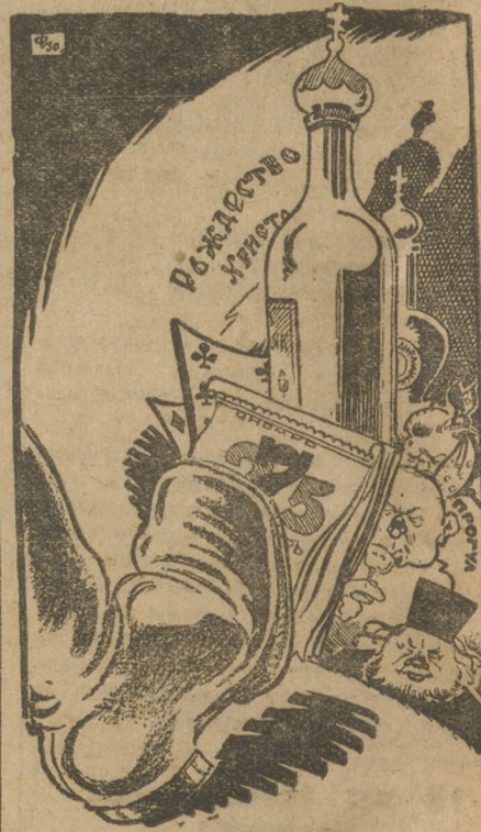
Прочь с дороги!