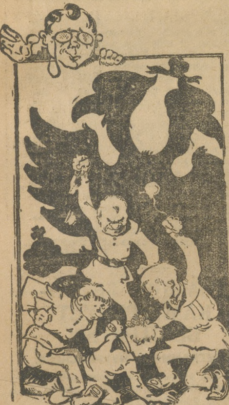
Хулиганство и его тень.