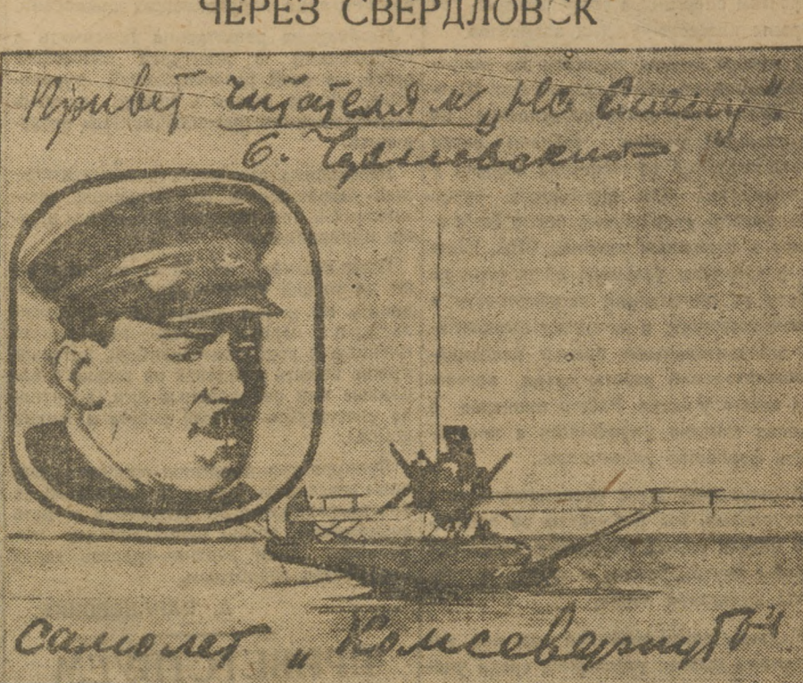
Самолет «Комсомолец», на котором экспедиция полетит на поиски американских летчиков. В овале — тов. Чухновский.