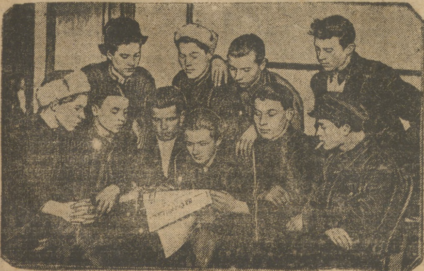
Группа михайловских комсомольцев, добровольно отправившихся на строительство Магнитостроя, — в редакции «На Смену».