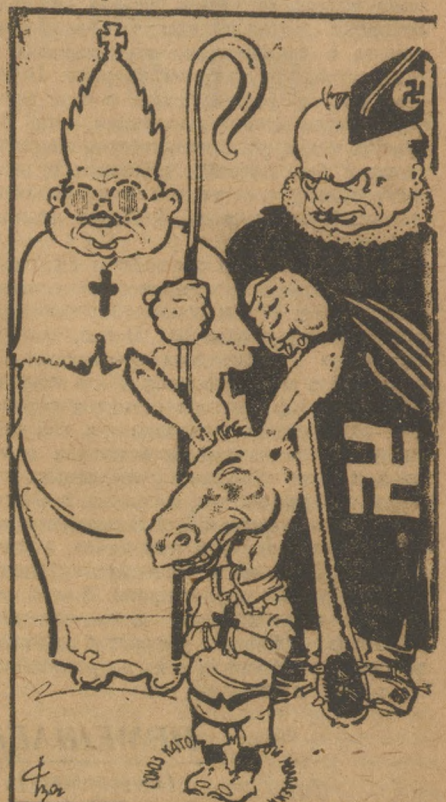
Папа, «мама» и их «дитяти».

Недавно 20 тыс. католической молодежи в Италии совершили погром в «святыне» и были приняты лапой.