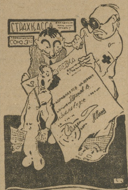
«При сем прилагается человек»...

Другой типичный случай. Больной зачислен в кандидаты для курортного лечения в июне. Тогда ему было полезно лечение в тубсанатории. Путевку ему