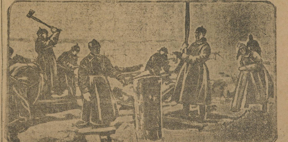
Субботник на ВИЗ'е. Заложка топлива.