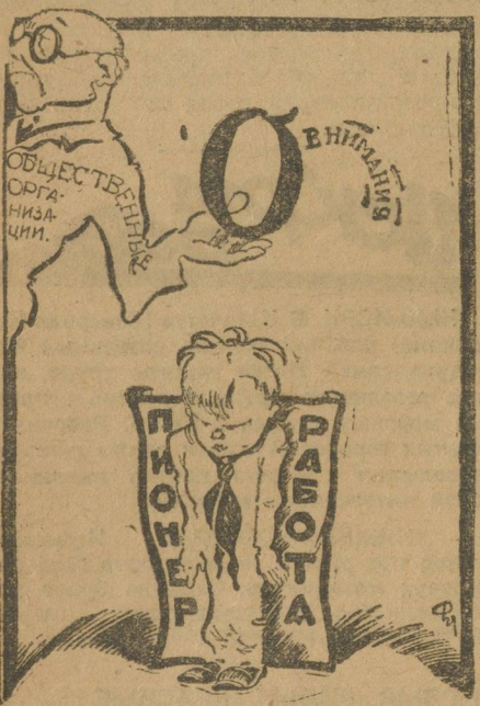
На старую тему.