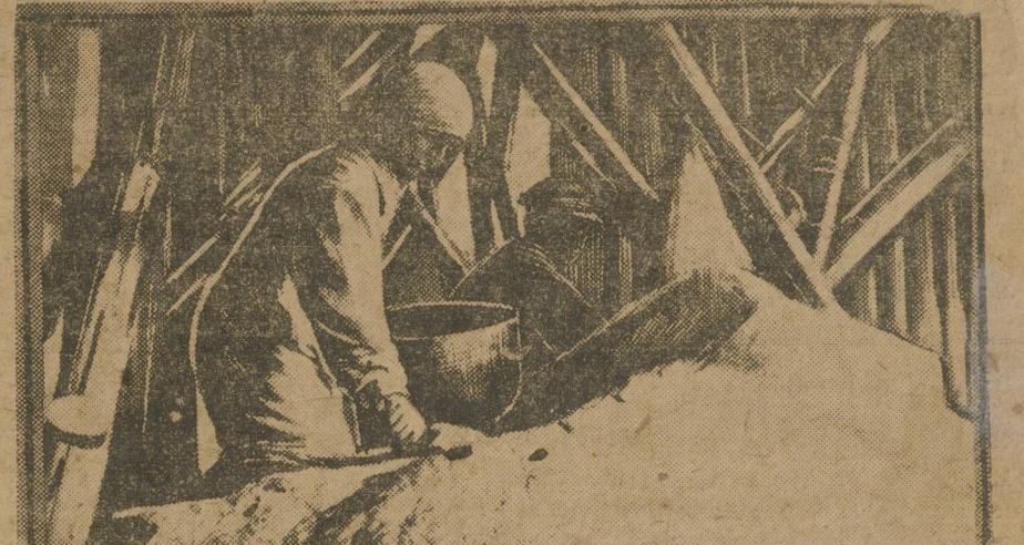
На курганской мельнице.