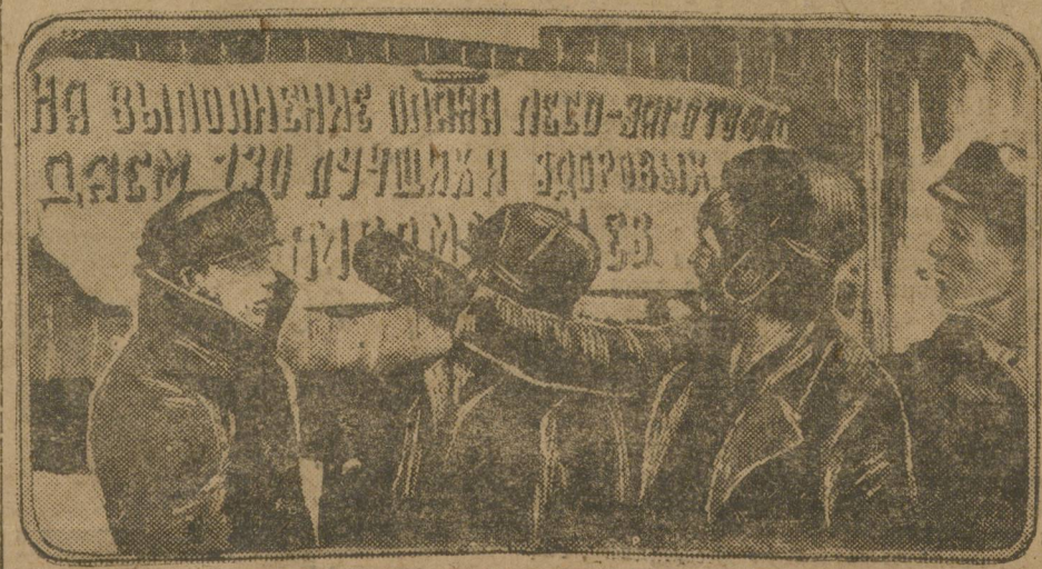
Перед отправкой шадринского отряда.