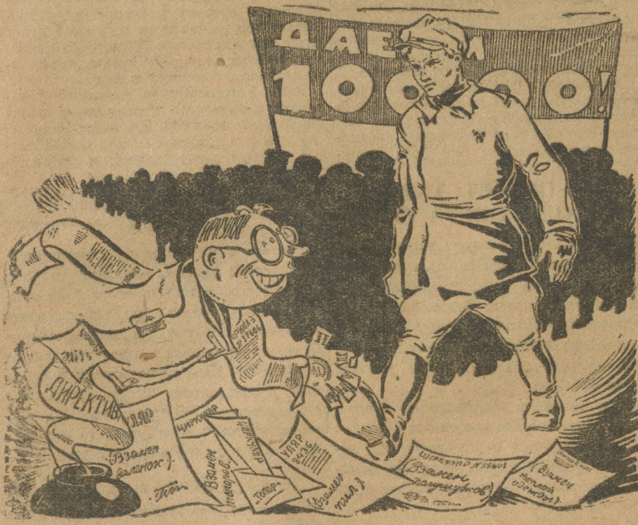
Рисунок В. ФОМИЧЕВА.