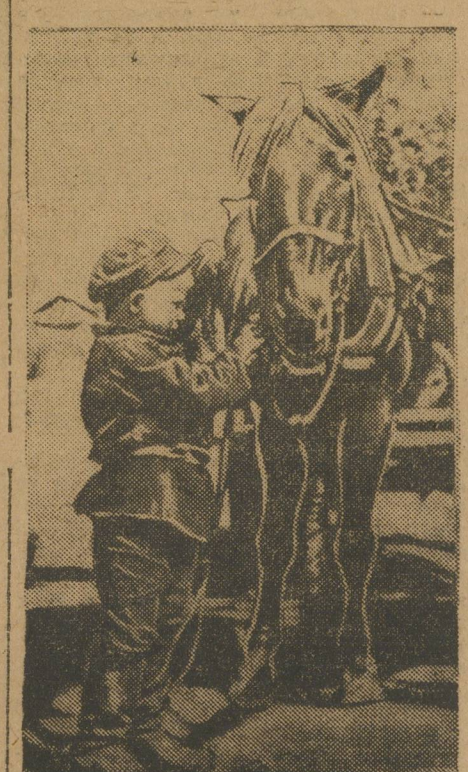
Юный колхозник (Варганский колхоз, Курганского округа).

Ячейка ВЛКСМ «Рассвет» при проведении массовой разносторонней работы организовала два колхоза: в деревню Зайновку СОЗ из 45 хозяйств, а в деревню М. Гусиную с-хоз, охватив 35 хозяйств. Но инициатива этой же ячейки