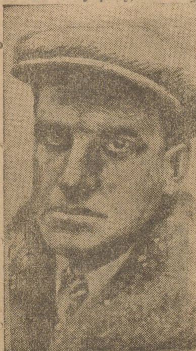
В. В. МАЯКОВСКИЙ.

от Шанхая отворачивали дредноуты. Не приравняю всю поэтическую слякоть, любую из лучших поэтических слов, не приравняю к простому к газетному факту,