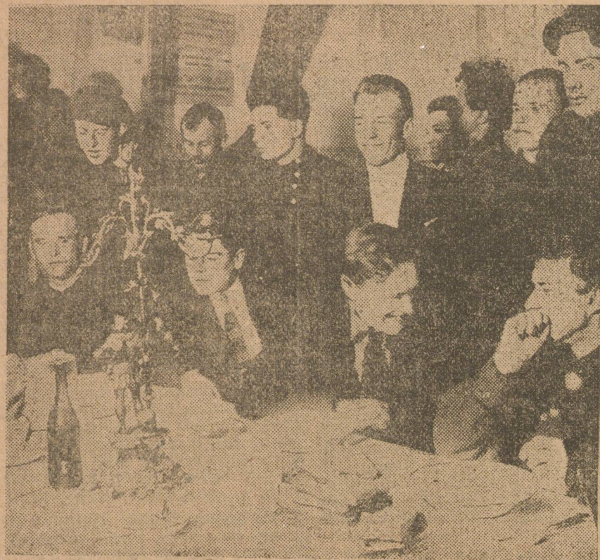
В ВОСКРЕСЕНЬЕ В СТОЛОВОЙ ЦРК. ОЧЕРЕДЬ У СТОЛА.

Кружки актива организуются в ячейках района, для изучения вопросов местного хозяйства и текущего момента.