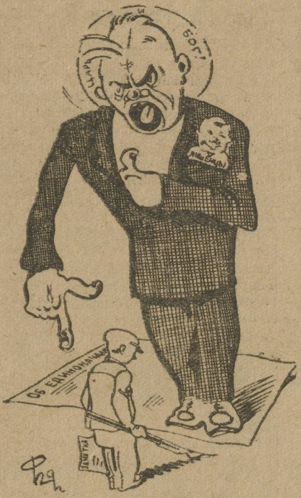
— Какое ты имеешь право при единоначалии писать на меня заметки?

Вслед мы наталкиваемся на печальный факт издевательств над рабором-общественником со стороны механика и директора завода. Нетерпимый факт зажима самокритики, воспитания рабочих в страхе перед диктаторской единоначалием — плоды массовой ненависти к советской власти. Цель задуть твердскую инициативу рабочих.