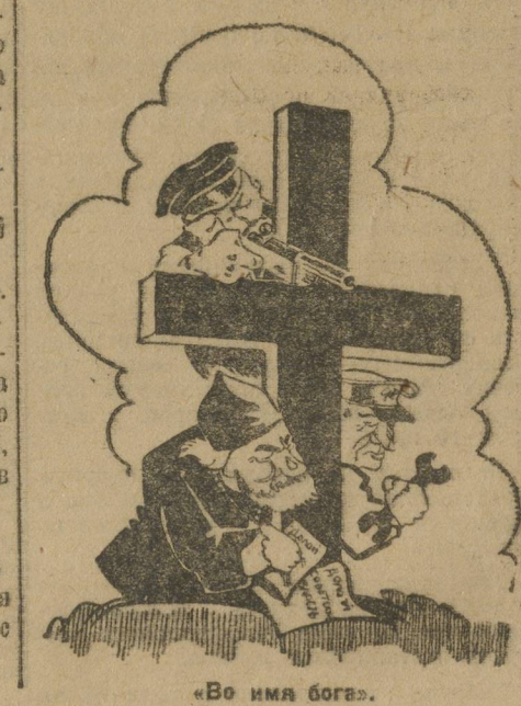
«Во имя бога».