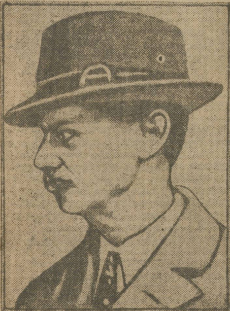
12-го декабря в Москву прибыл чрезвычайный полномочный посол Англии в СССР ЭСМОДН ОВИЙ. Вместе с послом прибыл советник посольства Геватки, первый секретарь посольства Патрик и др. члены посольства.