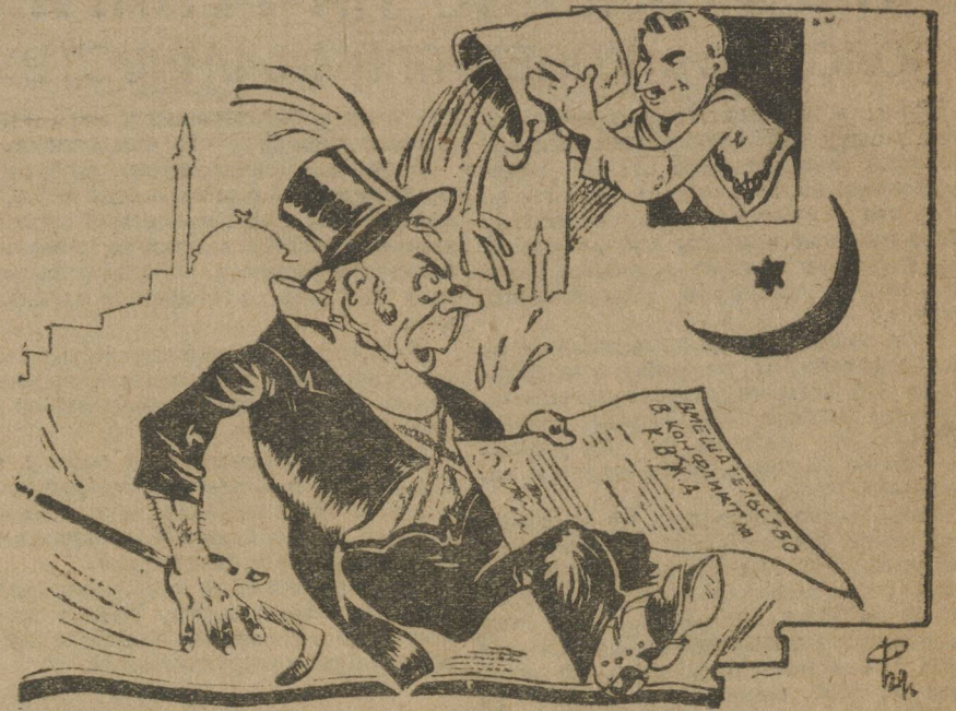
Ушат холодной воды на горячую голову

Турецкое правительство отказалось присоединиться к американскому заявлению о конфликте на КРЖИМ