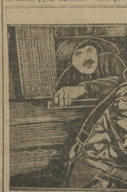
В шахте (Карабах).

Общая стоимость постройки 300-метрового боевого тира на областном стадионе определена в 38 тыс. руб. УОСПС и Уралсоюзнахим отпускают по 14.700 руб., «Динамо»—8.600 р.