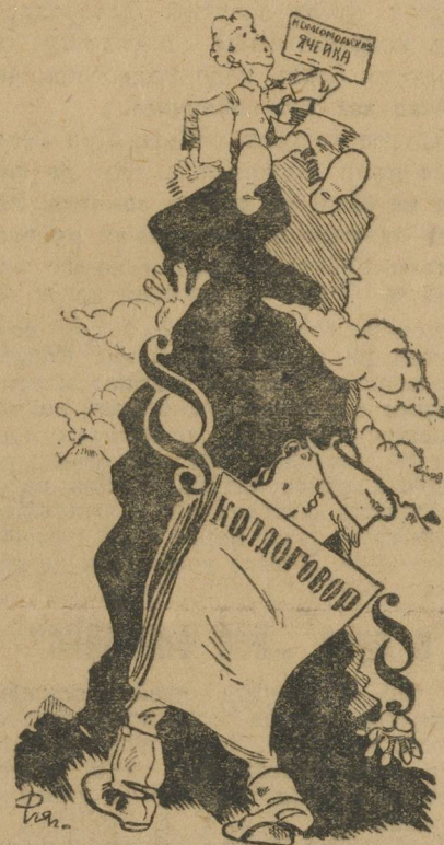
На высоте положения.

В Сарсинском стекольном заводе, ФЭК проверку коллективного договора почти «обесценили», так как не привлек к этому делу рабочие массы. Вместо обсуждения договора рабочими, это сделала комиссия из... пяти человек, которая разобрала ряд пунктов и на этом покончила. Аси.