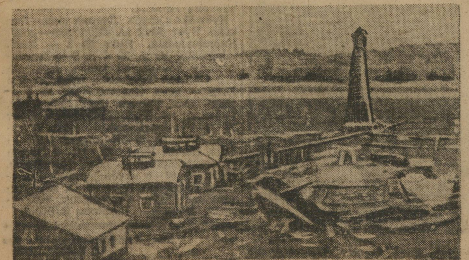
В Чусовских Городках.

— Несмотря на громадные трудности в работе мы уверены в блестящей и скорой победе. Мы надеемся в течение этого года добиться положительных результатов на наших нефтяных промыслах, т.-е. увидеть новые фонтанирующие скважины и иметь возможность направить в подарок рабоче-крестьянскому правительству первый красный эшелон уральской нефти!