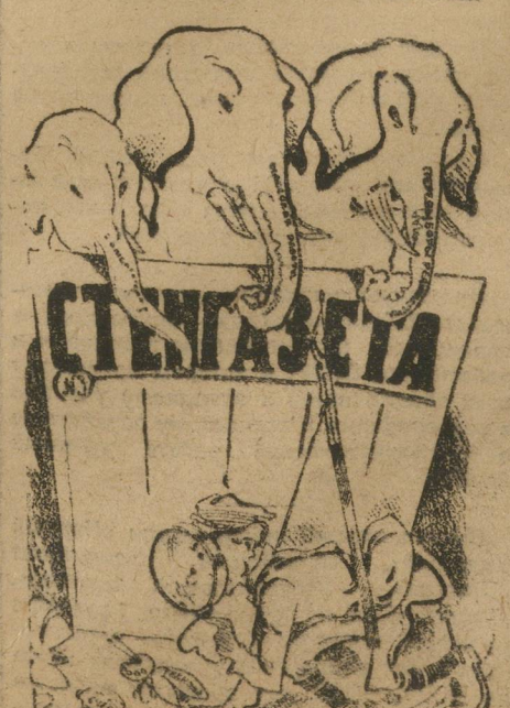
«Спешит и не прикетил»