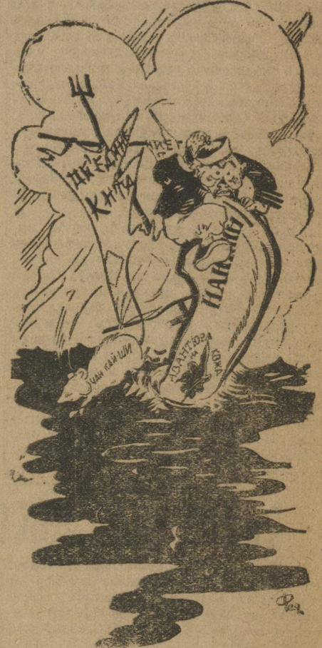
Плачевные итоги политики Нанкина.

ШАНХАЙ. Английские и американские истребители спешно вышли в Нанкин под предлогом эвакуации иностранных резидентов.