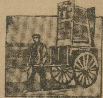
Газета французской компартии «Юманите», поставленная правительством под угрозу закрытия, ведет сейчас огромнейшую работу по привлечению широких масс французских рабочих себе на помощь. Задача сводится к тому, чтобы в кратчайший срок собрать необходимые средства для покрытия долга «Юманите» рабоче-крестьянскому банку.

Вышел первый номер газеты «Первый Ударный», издаваемый редакцией «Правды». «Коммунистической Правды», «Трудом» и др. во время съезда, 7 декабря в редакции «Первого Ударного» организована комитет работников и участвующих съезда ВЛКСМ СССР для проверки качества работы и организации работы.