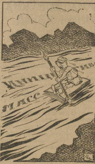
— Их не коснулась перестройка.