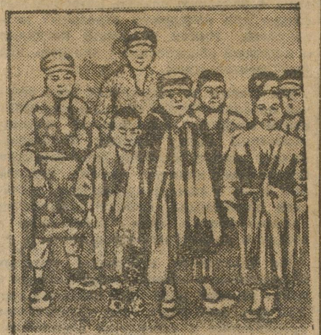
На снимке: Группа пионеров-японцев, принимавших активное участие в забастовке вместе с отцами и старшими братьями.

ПАРИЖ. ЗА 26 НОЯБРЯ СБОР СРЕДСТВ В ПОЛЬЗУ «ЮМАНИТЕ», СОСТАВИЛ СВЫШЕ 60 ТЫСЯЧ ФРАНКОВ. ИЗ ЭТОЙ СУММЫ НА ДОЛГ ИНДИВИДУАЛЬНЫХ ВЗНОСОВ РАБОЧИХ ПАДАЕТ ОКОЛО 10 ТЫСЯЧ ФРАНКОВ, СВЫШЕ 50 ТЫСЯЧ ФРАНКОВ ПОСТУПИЛО В ВИДЕ КОЛЛЕКТИВНЫХ ВЗНОСОВ ОТ ПРОФСОЮЗОВ, КООПЕРАТИВОВ, ЯЧЕЕК И РАЗНЫХ РАБОЧИХ ОРГАНИЗАЦИЙ. «ЮМАНИТЕ» В ТЕЧЕНИЕ НЕДЕЛИ УЖЕ ВТОРИЧНО ВНОСИТ В СЧЕТ УПЛАТЫ ДОЛГА БАНКУ 100 ТЫСЯЧ ФРАНКОВ.