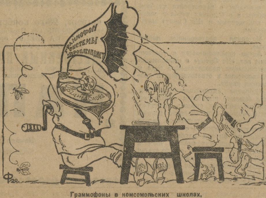
Грамофоны в комсомольских школах.

Прочитав газету «На Смену» № 259 от 13 ноября 1929 года об объявленном газетой конкурсе, я охотно отзываюсь на это дело. БОЛЬШОЕ ТОВАРИЩЕСКОЕ СПАСИБО «НА СМЕНУ» ЗА ХОРОШЕЕ МЕРОПРИЯТИЕ В ЕЕ РАБОТЕ. ИТАК ПРИНИМАЮ ВЫЗОВ ДОПОВ В. Я. (г. Ирбит).