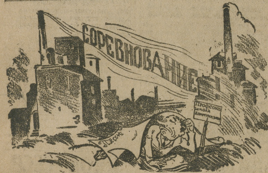
«Система руководства» в действии.

О чем говорит это признание? Почему система работы негодная и что это за «система»?