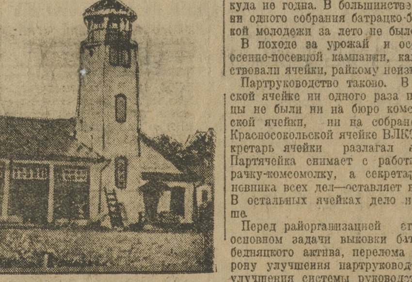
Новая пожарная часть на Уралабсте, открытая 7 ноября.