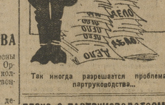
Так иногда разрешается проблема партруководства...