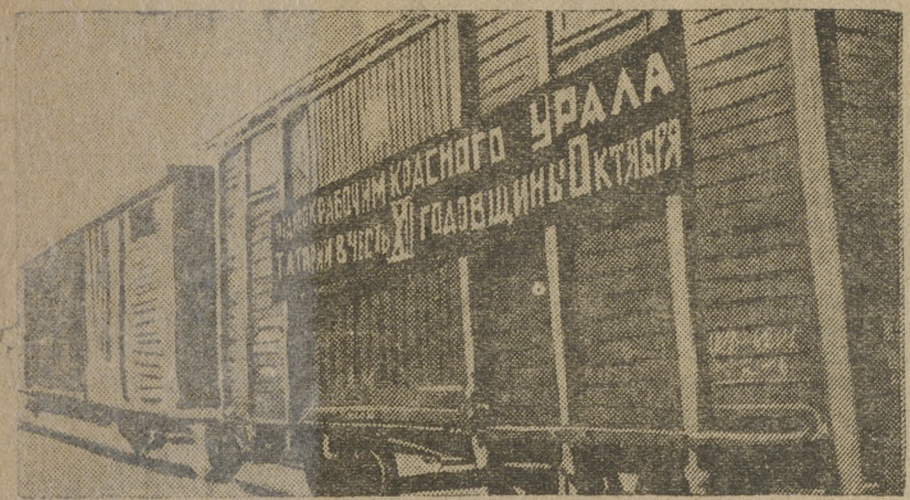
Хлебный эшелон Татарии в подарок уральским рабочим.