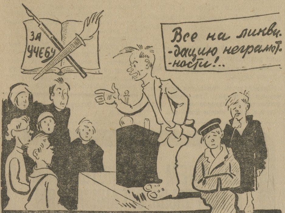
Льются торжественные речи...