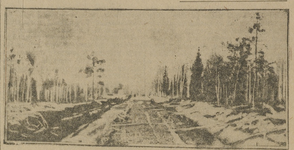
Дорожное строительство на Уралмедьстрое.