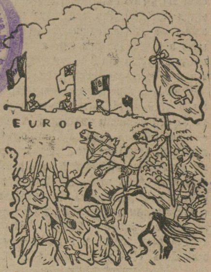
„ШТУРМ КРЕПОСТИ“ Так звучит в переводе подпись под рисунком, взятым из англ. газеты «Манчестер Гардиан».

Рисунок помогает понять ту свирепую кампанию против пролетарского государства, которую ведет сейчас буржуазная печать Англии. Буржуазия рисует положение так, что будто бы «азиаты-большевики» в лице советского правительства постоянно грозят Европе нападением, зовя еще за собой угнетенные колониальные народы и Европа толь ко обороняется от большевиков.