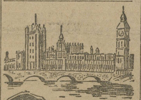
Здание английского парламента, где происходили прения.

«Смущенная речь Чемберлена, лишенная фактического содержания и внешне-политических перспектив, — пишет газета, — равно, как и блестящая речь Ллойд-Джорджа (вожака либералов), который был в ударе, — обострили и без того затруднительное положение правительства до беспомощности. Правительство располагает большинством, но морально обанкротилось (разорилось)».