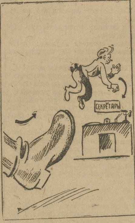
Вот это угодил..

Как иначе, кроме политической близорукости коллектива и ячеек назвать вышеприведенные факты? Иначе никак назвать нельзя ибо «политическая близорукость» зашла еще дальше.