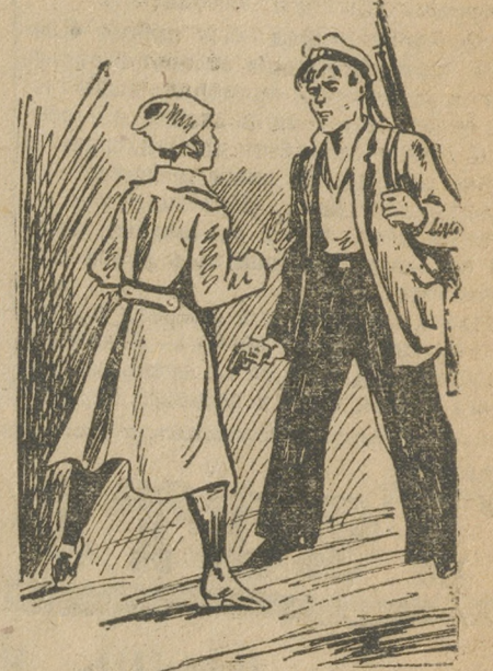
... Меня не надо, я с вами...