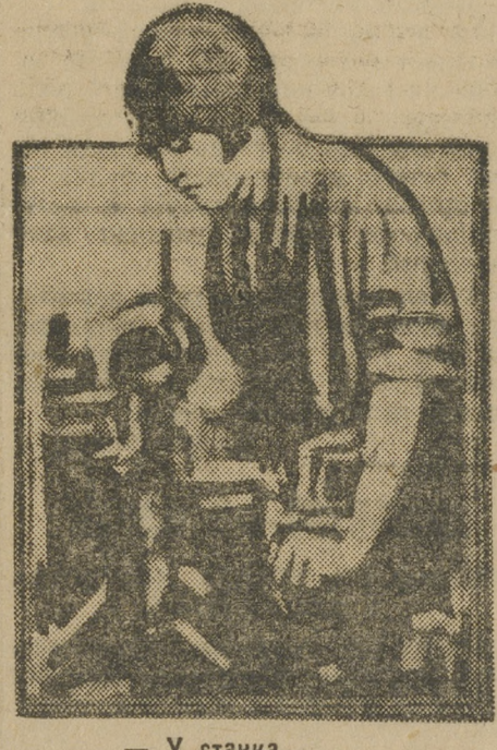
— У станка...