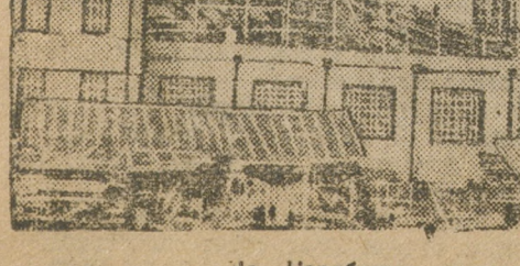
На Челябинском скаты леса. Корпус станции готов.