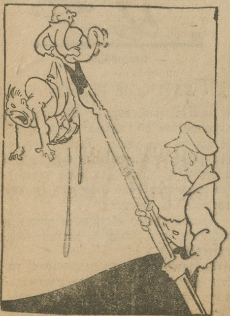
Юнкорское перо в действии.

«НА СМЕНУ» ОБЛАДАЕТ ЗАДАТКАМИ, КОТОРЫЕ ДАЮТ ЕЙ ВОЗМОЖНОСТЬ ПРЕВРАТИТЬСЯ В ДЕЙСТВИТЕЛЬНОГО КОЛЛЕКТИВНОГО ОРГАНИЗАТОРА МОЛОДЕЖИ. ЗА ЭТО ГОВОРИТ УРОВЕНЬ БОЛЬШИНСТВА СТАТЕЙ, НЕСОМНЕННАЯ ЧУТКОСТЬ ГАЗЕТЫ, ТЕСНАЯ СВЯЗЬ С МЕСТАМИ. ГАЗЕТЕ НЕХВАТАЕТ УМЕНЬША ЛЕНИНСКОГО АНАЛИЗА КОНКРЕТНОЙ ОБСТАНОВКИ ЕЙ НЕ ХВАТАЕТ «БОЛЬШЕВИСТСКОЙ НАСТОЙЧИВОСТИ»... («ЮНЫЙ КОММУНИСТ»).