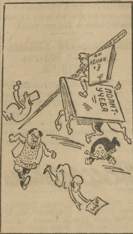
С революционной теорией против классового врага.