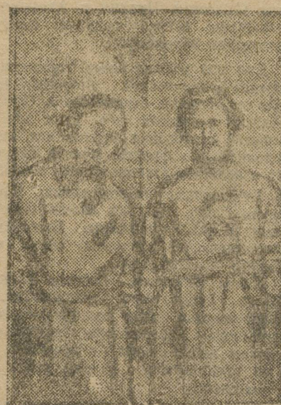
Комсомольцы-воспитанники школы Дункан.

Выступления прошли с редким триумфом. Англичане с боя брали места, заучивали мелодии, и вскоре в танцевальных залах джентльмены в цилиндрках танцевали новый, вошедший в моду фокстрот, на мотив «Пионеры мы».