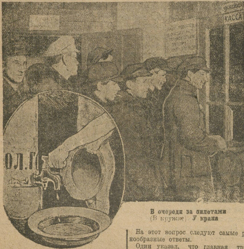
В очереди за билетами (В кружке). У крапа

Конечно, мы знаем, что любопытство порождает, но как не завести порок в таких подходящих условиях. И вот порочные люди спрашивают себя и других: «Скажите, почему это? Почему в бане нет воды, нет пара, нет душа, а есть только очередь?.. Очереди, правда в двух видах — одна в одетом, другая в голом, — но от этого никому не легче».