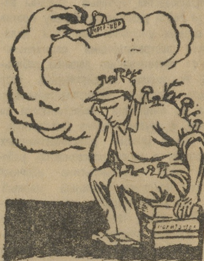
В ожидании директивы.