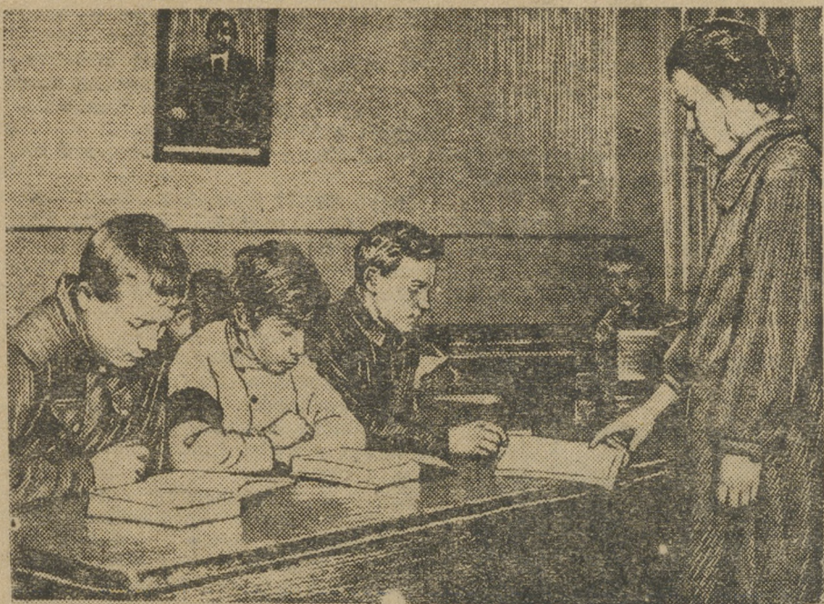
Занятия группы малограмотных в базовой школе на Цыганской площади.

В клубе им. Ленина должен быть штаб. Дежурный член правления