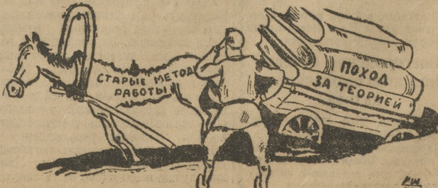
«Мальбрук в поход собрался».