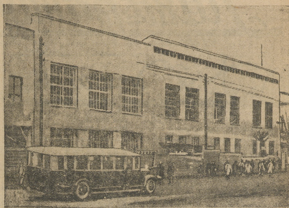
Постройка драмтеатра заканчивается.