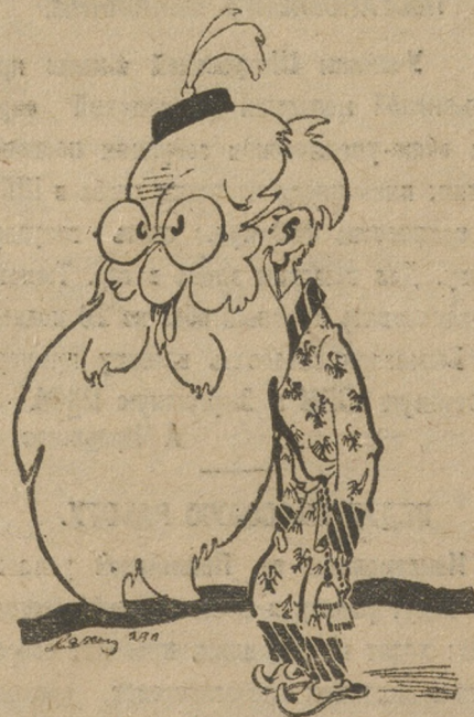
Вождю-творителю мировой социалдемократии, Карлу Каутскому, исполнилось 75 лет.

нию партии, в выполнении пятилетнего плана социалистического строительства, в социалистическом соревновании, в наиболее быстром проведении хлебозаготовок, в строительстве колхозов и совхозов, в борьбе с классовым врагом уральский комсомол будет в первых шеренгах борцов за дело Ленина, будет надежной опорой коммунистической партии и ее Ленинского ЦК.