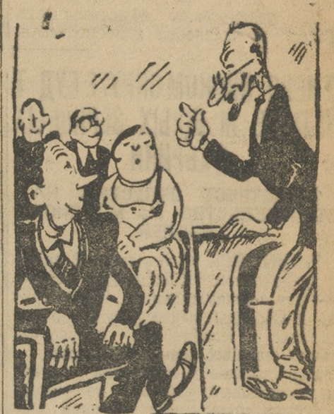
— Теперь позволим критиковать Пал Палычу. Ваше слово, добрейший!..

нову пролили увеличением, если он будет говорить о недостатках работы аппарата.