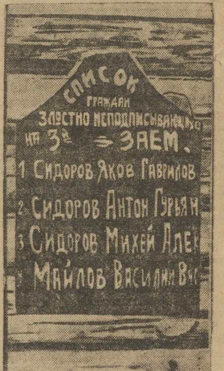
Черная доска в селе Тугулым, Тюменского округа.