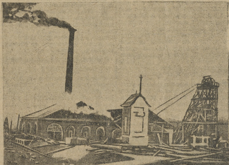
Первомайский рудник Карабашского медеплавильного комбината, с момента вступления в соц. соревнование повысил производительность на 85 проц.