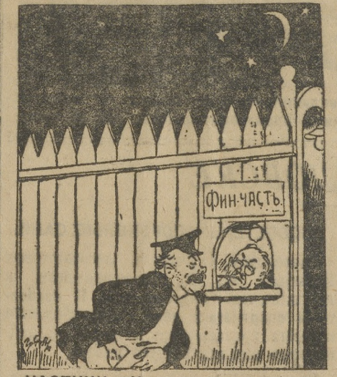
ЧАСТНИК.—И как вы, товарищ фининспектор, скинули мне налог, я вас не забуду... масла принесу.

твой ми демонстрирую тебе бессилие, а твоёе благоумыслие, то мы не прочь преподать им наглядные уроки в мощи красного оружия.