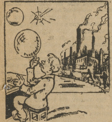
В тиши райкомовских кабинетов.

Во главе Чермозской организации стояло оппортунистическое руководство, которое не было способно на деле выполнять политику партии, творило правые дела на практике, душило самокритику, зажимало всякую критическую мысль, усыпляло