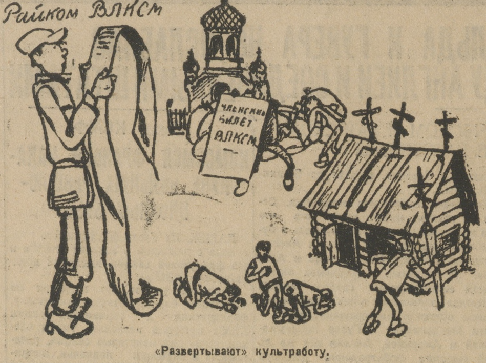
«Развертывают» культурную работу.