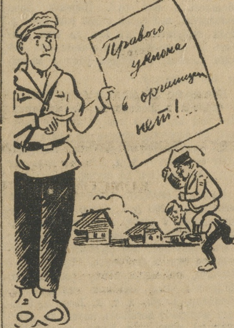
Под прикрытием резолюции.