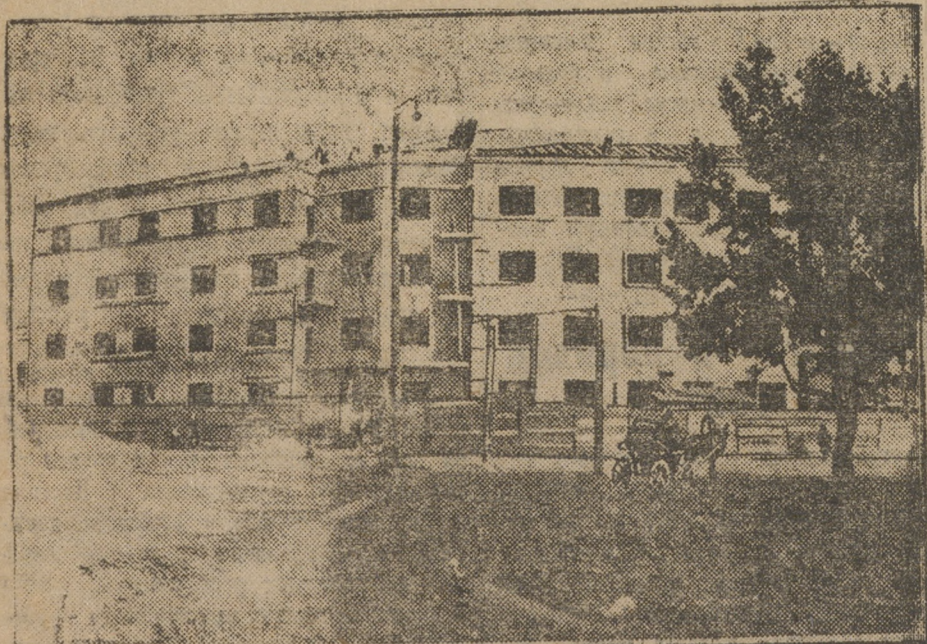
Новый дом Уралмета, заканчивающийся постройкой.