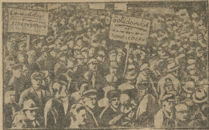
На снимке—шестые бастующих трубопрокладчиков Берлина, героически борющихся одновременно на три стороны: против предпринимателей, реформистов и с.-д. полиции. Часть предпринимателей сдались. Трубопрокладчики решили бороться до полной победы.