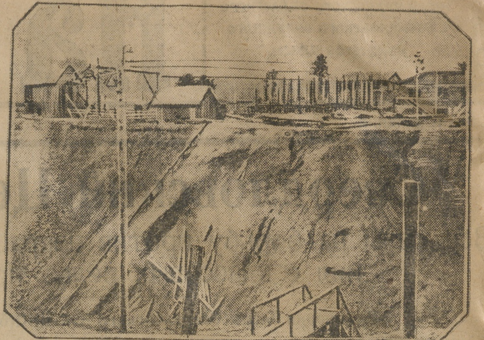
Пробивка новой капитальной шахты на Сталинском руднике.