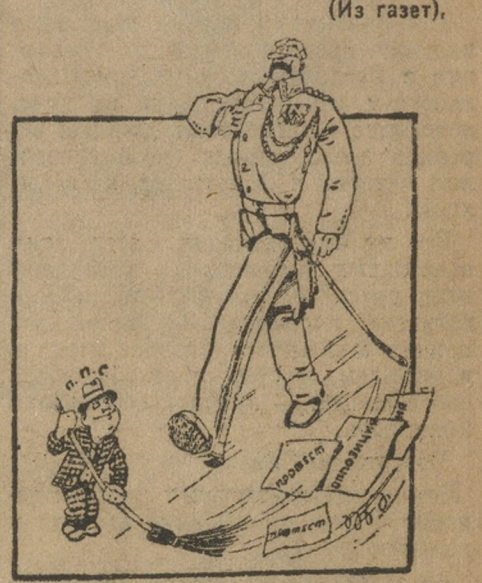
ппс в «оппозиции».

ППС (партия польских социалистов), несмотря на свою оппортунистичность к Пилсудскому, всячески содействует укреплению его диктатуры.