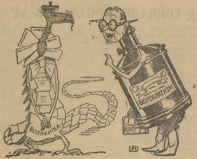
— А не перейти ли, матушка, и нам с тобой на непрерывную неделю? — Хорошо бы... Боюсь только, что РКИ перейдет раньше нас.