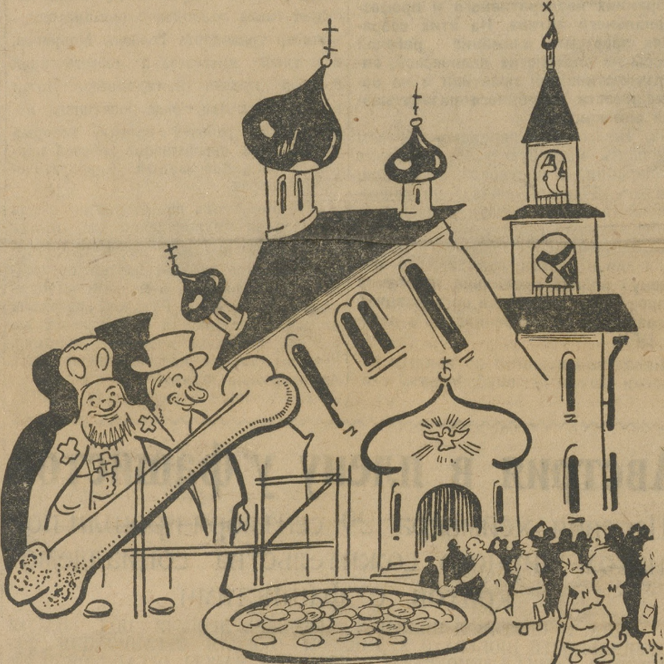
Последняя надежда церковников.