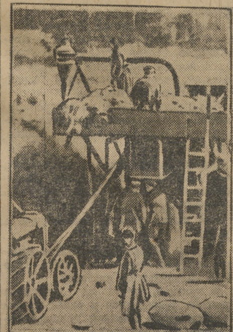
Обмолот хлеба трактором в колхозе «Гигант».