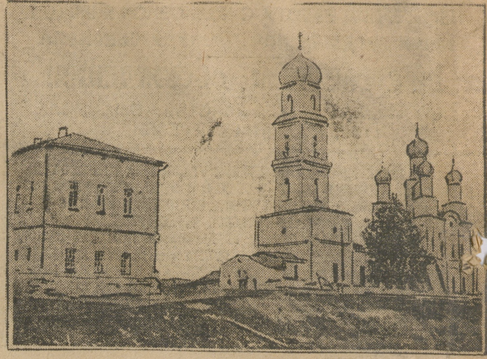
В этом маленьком домике ютятся райком партии В.Чусовских Городка, милиция, общажитие сезонников и т. д. Рядом большая церковь, которую пощещают полсотни старух. Рабочие В.Чусовских Городков постановили закрыть церковь использовать ее на культурные нужды. Это решение должно быть немедленно проведено в жизнь.